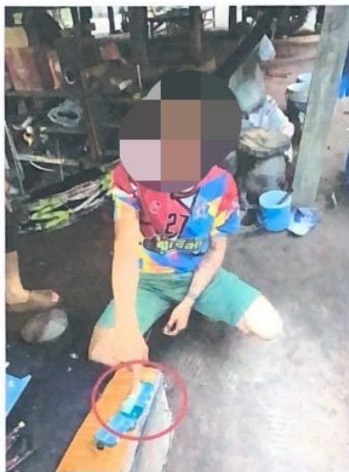
ภาพถ่ายประกอบการจับกุม

เมื่อวันที่ 8 ธ.ค. 2566 ได้มีการจับกุมตัวผู้ต้องหา “ มียาเสพติดให้โทษชนิดร้ายแรงประเภท 1 (ยาบ้า) ไว้ในความครอบครองโดยฝ่าฝืนกฎหมาย ” จำนวน 1 ราย 1 ของกลาง ยาบ้าทั้งหมด 2 เม็ด